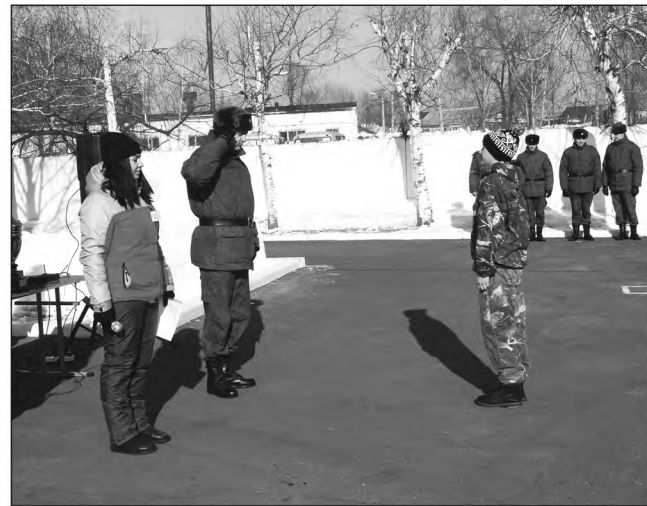
Приветственный рапорт командиру части