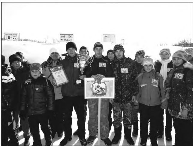
Победители – команда Шумненской школы