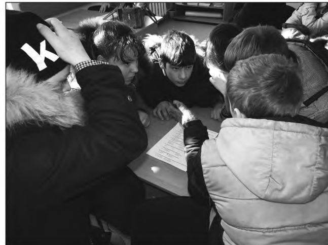
Тест на знание истории Отечества