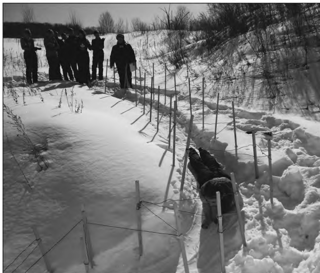
Ребята с честью прошли все испытания «Зарницы»